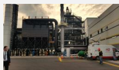
Inceneratori i Elbasanit